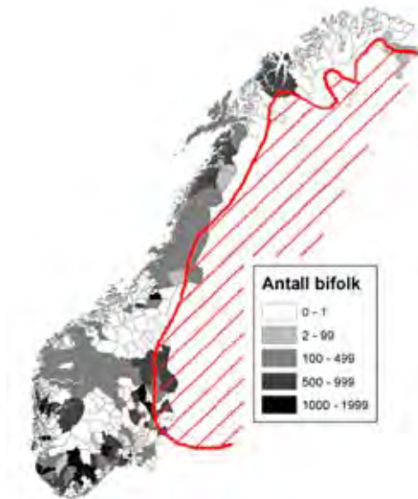
Utbredelse av birøkt og bjørn i Norge.

Birøkt drives over hele landet (se kart) av ca 4 000 birøktere med vel 80 000 bikuber. Mange har næringsrettet virksomhet i tillegg, noen er birøktere på heltid. Honningproduksjonen gir årlig ca 100 millioner kr i inntekt til primærprodusentene, med en minst like stor gevinst i form av pollinering av frukt, bær, oljevekster og ville planter. I Hedmark er birøkt for mange en betydelig tilleggsinntekt. Her er det lyngtrekk, gode vilkår for birøkt, og som regel har dette fylket det største årlige honningutbyttet per kube. Birøktere i andre fylker flytter også bikuber på lyngtrekk til Hedmark.