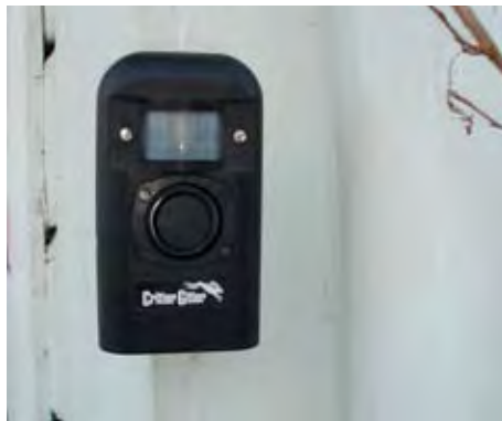
«Crittter Gitter» monteres slik at dyrets bevegelser utløser skremsekslyd.