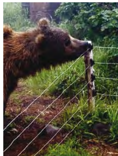
Strømmerder kan gi effektiv beskyttelse mot bjørneskader.

Tradisjonelle metoder for å beskytte bikuber fra bjørn før strømmerde ble tatt i bruk, var å stille kubene høyt opp på et steinfundament eller gjerde dem inn med stein eller andre typer inngjerdingsmaterieell. Enkelte steder i Europa og Nord-Amerika bygger man bl a plattformer for kubene, for å gjøre dem utilgjengelige for bjørn. En slik plattform må være minst tre meter høy (husk at den skandinaviske brunbjørnen kan bli 280 cm lang). Om stolpene som plattformen hviler på er laget av treverk eller trestammer, må disse dekkes over med stålplater for å hindre at bjørnen klatrer opp. En stige gjemmes i nærheten og brukes for selv å komme til kubene.