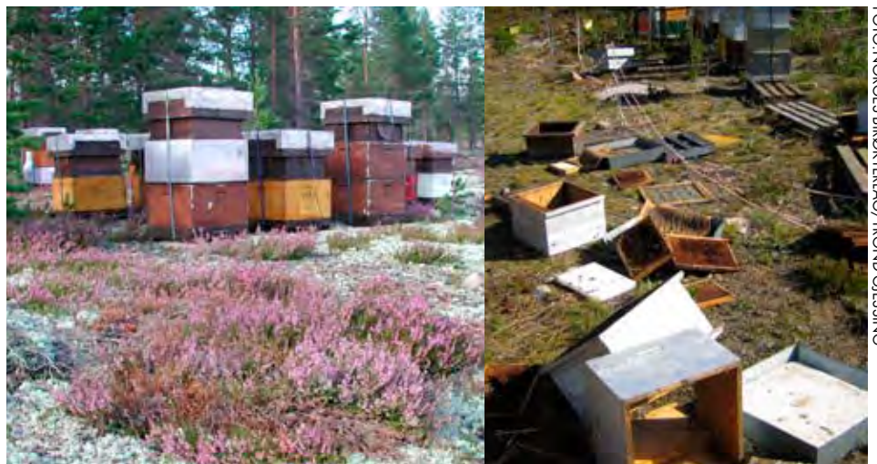
Vandrebirøkt er spesielt utsatte for skader der bjørn forekommer.

Direktoratet for naturforvaltning har satt en standard for oppføring og vedlikehold av elektriske gjerder til rovviltsikring, utarbeidet av Norsk viltskadesenter ved Bioforsk Tjøtta ( www.viltskadesenter.no ). Når det gis tilskudd til inngjerding av vandrebigårder, vil Fylkesmannen sette som vilkår for tilskuddet at oppsettingen gjennomføres i henhold til den fastsatte standarden, eventuelt med lokale tilpasninger. Du kan selvsagt benytte andre tiltak, dvs alternative strøm Gjerdeløsninger, men husk at slike tiltak